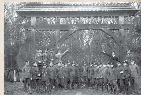
Przy bramie do Białowieckiego PN

Dziś wiele osób zwraca się do ZSL w Białowieży z pytaniami o listy absolwentów lub inne pamiątki związane z nauką ich bliskich, traktując naszą szkołę jako kontynuację szkoły międzywojennej. I słusznie – bo także jesteśmy dumni, że możemy kształcić młodzież dla dobra polskich lasów.